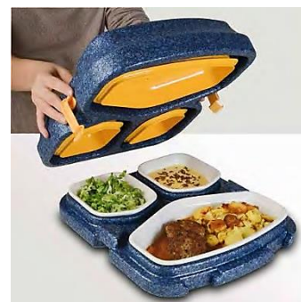
NEU... Menü-TOP BOX