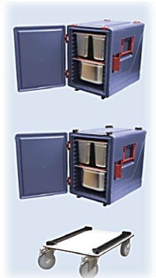
Temperaturverlust (bei einer blü/box 52 gn)