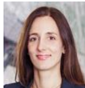
Team Büroservice Telefonannahme